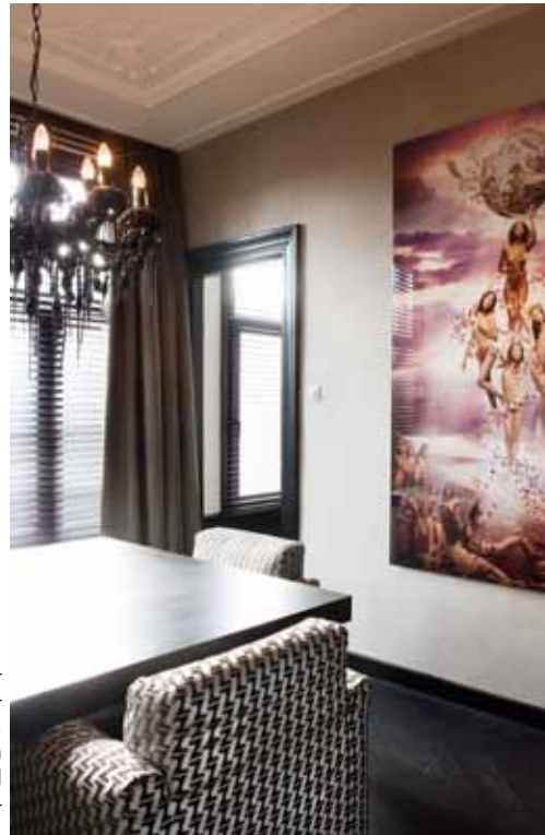
Foto rechts: de witte bank van Frigerio is bekleed met een linnen stof. Het kleed van koeienhuidvakken is van het Spaanse Miyabi Casa. De bestaande parketvloer is door middel van oliehardwax zwart gekleurd door Vloertotaal Haarlem waardoor het een intieme, eigentijdse basis vormt.