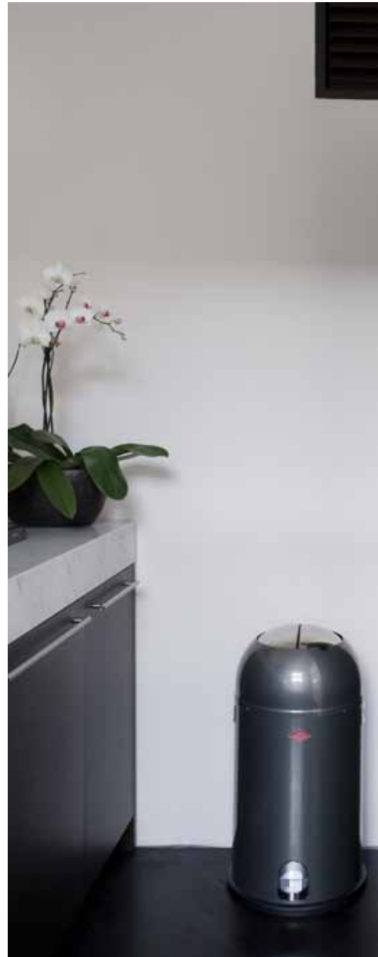
De keuken bevindt zich in een soort nis naast de eettafel. Hier is elke centimeter gebruikt. Choc Studio werkt nauw samen met het bedrijf Casa Creativa, die de ingenieuze plannen voor het appartement in de praktijk uitvoerde.

“Er moest een combinatie komen van een hotelsfeer met Aziatische elementen. Dat vleugje oosters hebben we door het materiaalgebruik er in gebracht”