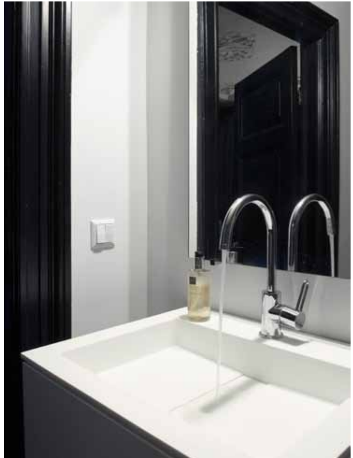
Hoewel de badkamer niet groot is, voelt ze toch riant aan. De ruimte is bewerkt met leemkleurig tadelakt, waardoor er een stoere hamamsfeer ontstaat. En wie heeft er ooit gezegd dat kunst niet thuishoort in een badkamer?!

juist prettig. Zoals met elke nieuwe klant, zijn we ook met deze bewoner gaan kijken wat zijn wensen waren. Hij had plaatjes uitgescheurd, maar zijn voorkeuren qua stijl lagen best breed dus toen zijn we gaan filteren. Er kwam al snel uit dat er een combinatie moest komen van een hotelsfeer met Aziatische elementen. Dat vleugje oosters hebben we er vooral door het materiaalgebruik in gebracht. Zo zit er sisal op de muur en is er tadelakt in de badkamer gebruikt. De bewoner had al diverse Aziatische kunstvoorwerpen die we in het appartement hebben gebruikt. Die geven nog eens een extra oosterse touch aan het geheel.”